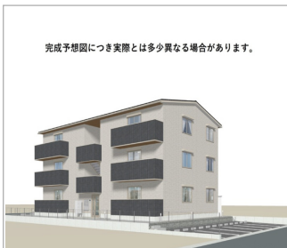
完成予想図につき実際とは多少異なる場合があります。