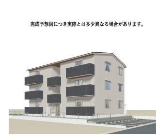
完成予想図につき実際とは多少異なる場合があります。