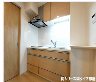
同シリーズ同タイプ部屋