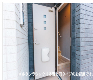
※ルタンラシックⅢ多量と同タイプのお部屋です。