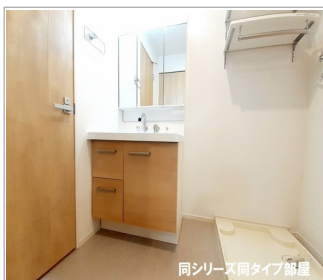
同シリーズ同タイプ部屋