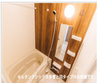
※ルタンラシックⅢ多量と同タイプのお部屋です。