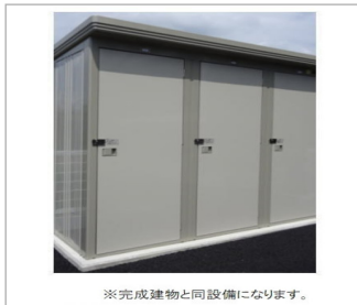
※完成建物と同設備になります。