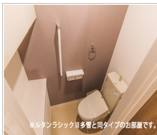
※ルタンラシックⅢ多量と同タイプのお部屋です。