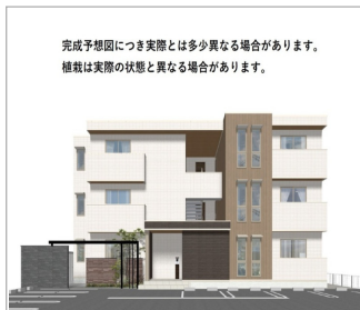
完成予想図につき実際とは多少異なる場合があります。 掲載は実際の状態と異なる場合があります。