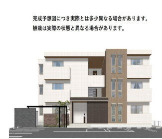
完成予想図につき実際とは多少異なる場合があります。 掲載は実際の状態と異なる場合があります。