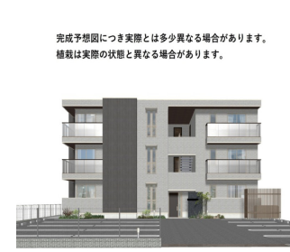
完成予想図につき実際とは多少異なる場合があります。掲載は実際の状態と異なる場合があります。