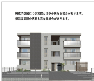
完成予想図につき実際とは多少異なる場合があります。掲載は実際の状態と異なる場合があります。